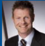
Dietmar Lager Unternehmenssiedlung IndustriePark