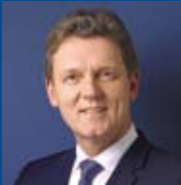
Dieter Krone Oberbürgermeister der Stadt Lingen (Ems)