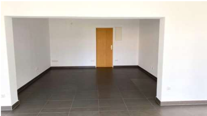
Ansicht Büro hinten