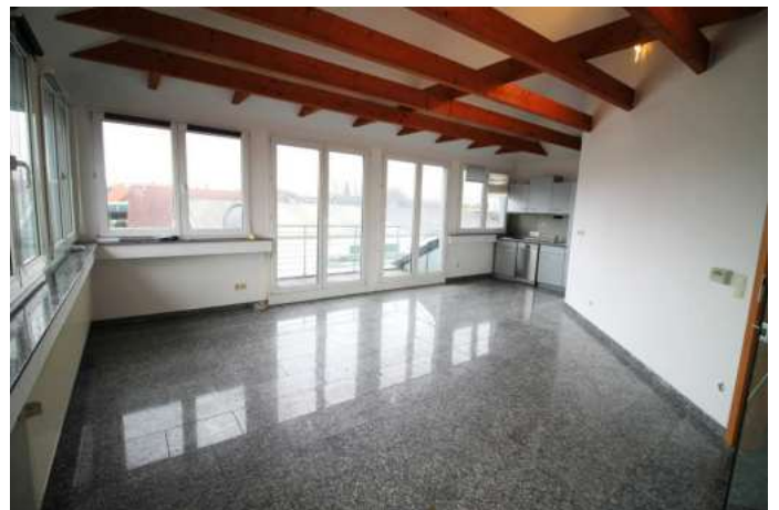
Büro 1 + Balkon + Küche