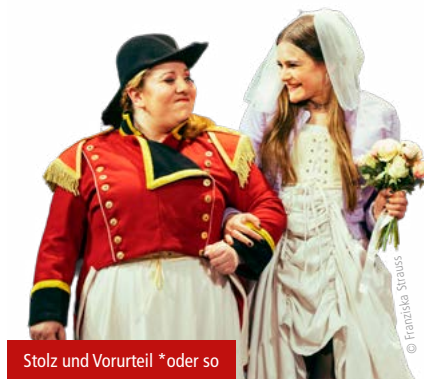
Stolz und Vorurteil *oder so

Der seltsame Fall des Dr. Jekyll & Mr. Hyde Dienstag, 29. April 2025 S. 39