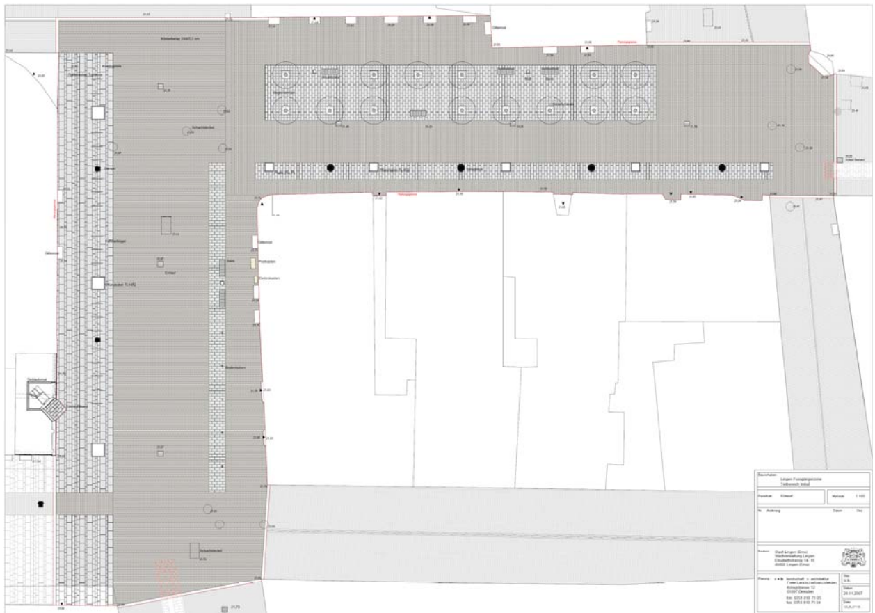
Abb. Nr. 6: Der aktuelle Gestaltungsplan des Initialprojektes, der nun Grundlage für die Ausführungsplanung sein wird.