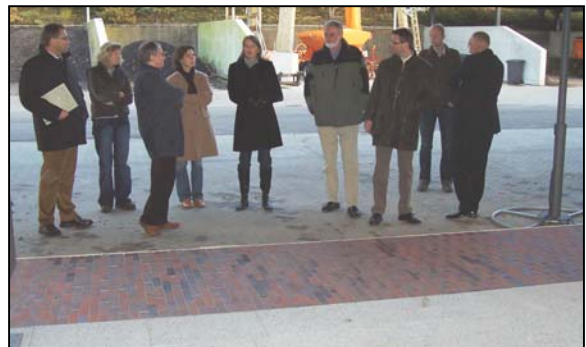
Abb. 1: In zahlreichen Terminen diskutierten Vertreter der Anlieger, Verwaltung und Politik die vorgeschlagenen Materialien und ausgestellten Elemente.

Wie wird Sie denn nun wirklich aussehen, unsere neue Fußgängerzone? Welche Möbel kommen zum Einsatz, welche Farbe haben die Bänke, wie sehen die Leuchten aus, wie das Pflaster? Und ist das auch nicht rutschig?