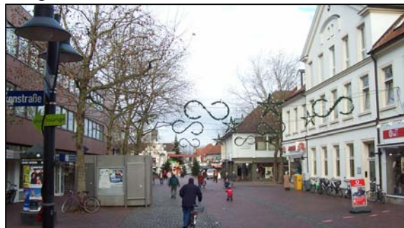
Abb. Nr. 5: Der Eindruck der Initialfläche in diesen Tagen. In einigen Wochen wird die WC-Anlage an den Pferdemarkt versetzt, wo sie die abgängige vorhandene Anlage ersetzen wird. Ab April 2008 wird der gesamte Bereich dann in neuem Glanz erstrahlen.

los mit der Neugestaltung der Fußgängerzone. Bereits im Januar werden vorbereitende Tiefbauarbeiten durchgeführt, die vorhandenen Bäume gefällt und die Fahrradabstellanlage abgebaut. Der enge Zeitplan ist Voraussetzung dafür, dass die Bauarbeiten im April abgeschlossen werden können und der erste Teil der Lingener Fußgängerzone in frischem Glanz erstrahlt. Damit die Arbeiten reibungslos und ohne allzu große Einschränkungen für Anlieger, Lieferanten und Fußgänger abgewickelt werden können, ist eine gute Baustellenorganisation und Abstimmung mit allen Beteiligten und den unmittelbar Betroffenen zwingend erforderlich. Die Fachleute der Verwaltung sind sich der Verantwortung und Herausforderung bewusst und planen bereits frühzeitig den abschnittsweise durchzuführenden detaillierten Ablauf der Gesamtmaßnahme. Selbstverständlich wird es ohne Einschränkungen über einen überschaubaren Zeitraum nicht gehen – wir gehen jedoch professionell und gut vorbereitet an die Arbeit, davon werden Sie sich überzeugen können. Und das meinen wir ernst: Während der gesamten Baumaßnahme sind wir für Sie