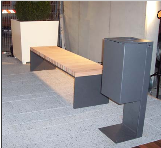
Abb. 2: Sitzbank (hier ohne Rückenlehne) zwischen Müllbehälter und Blumenkübel. Anhand der ausgestellten Beispiele konnten Farben, Oberflächen und Gestaltungsdetails begutachtet und diskutiert werden.

Die Wahl der Ausstattung ist um so wichtiger, da die Auswahl auch für alle anderen Bereiche der Fußgängerzone verbindlich ist und damit den Gestaltungsrahmen insgesamt festlegt.