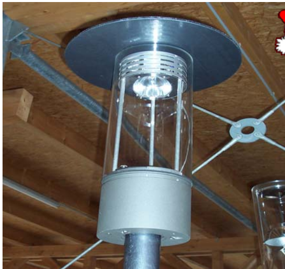
Abb. Nr. 4: Diese Laternen werden zukünftig die Burgstraße aufwerten. Die ersten Exemplare sind im Möblierungsband im Initialbereich vorgesehen.

Wasserspieles, das bei den Bemusterungsterminen durchaus auch kontrovers diskutiert wurde, da bereits viele Wasserelemente im Bereich des Markt-