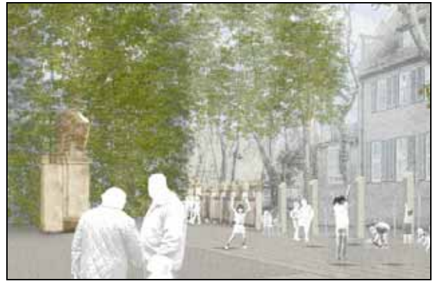
Abb. 5: Interaktive Wasserspiele werden vom Büro wbp kombiniert mit städtebaulichen Gestaltungselementen

Das Begrünungskonzept des Büros bezieht sich auf geschichtliche Strukturen: Während in der mittelalterlichen Altstadt Solitäräume das Bild prägen, werden die Erweiterungen der Fußgängerzone mit einer Lindenreihe angedeutet. In den Kreuzungsbereichen des Stadtgrabens plant das Büro Wasserplätze, die mit interaktiven Wasserspielen versehen sind.