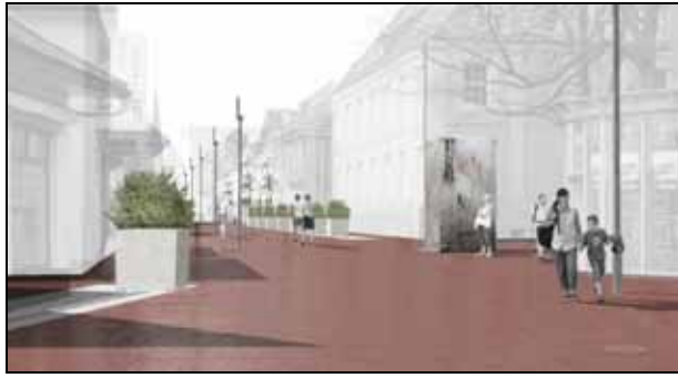
Abb. 6: Das Planungsbüro r&b aus Dresden räumt auf und ordnet neu: Dieses Prinzip wird konsequent durchgezogen und überzeugte das Auswahlgremium

In der Looken- und Burgstraße wird über große Wassermonolithen das Thema Stadtgrabenquerungen in das Konzept aufgenommen. Die Große Straße und die Marienstraße gestalten die Planer als Einheit, die den Marktplatz bindet. Mit der Baumreihe, die sich in der Großen Straße fortsetzt, wird eine wichtige lenkende Maßnahme entwickelt, um die Große Straße stärker an die übrigen Straßenzüge der Fußgängerzone anzubinden. Um den Marktplatz zukünftig flexibler nutzen zu können, macht das Planungsbüro den Vorschlag, die gesamte Fläche in Anspruch zu nehmen. Das Gestaltungselement „Materialband“ spielt auch hier als äußere Einfassung eine Rolle. Die Planer sehen als eine Hauptnutzung die Außengastronomie und unterstützen diese durch große Sonnendächer und einer Rahmung aus überdimensionalen Blumenkübeln, in denen sich Bäume befinden. Bei Großveranstaltungen können somit die Pflanzen „zur Seite gestellt“ werden.