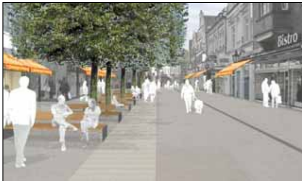
Abb. 4: Das Büro wbp aus Bochum zeigt hier am Beispiel der Burgstraße Belagstruktur, Möblierung, Begrünung sowie ein Markisenkonzept

Auch der Entwurf des Planungsbüros wbp aus Bochum beschäftigt sich mit einigen interessanten Gestaltungsmerkmalen: Die Oberfläche der Fußgängerzone besteht aus Klinker und Natursteinplatten. In der Marienstraße, Große Straße, Am Markt und Burgstraße überwiegt der Klinkerbelag, in den ein natursteinfarbenes „Laufband“ eingelegt wird, in der Lookenstraße fällt das „Laufband“ großzügiger aus.