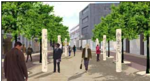
Abb. 3: Das Büro Lohaus & Carl möchte Linger Geschichte in Form von interaktiven „Kivelingstelen“ erlebbar machen

Als besonderes Gestaltungselement bringt das Büro „Kivelingstelen“ in den Entwurf mit ein: Das sind Stelen, auf denen mit einer besonderen Technik die Abbildungen von Kivelingen aufgetragen werden. Diese „Kivellinge“ erhalten ihren Standort in den Eingangsbereichen zur Fußgängerzone und auf der Fläche Am Markt zwischen Castellstraße und Burgstraße. Mit Lautsprechern versehen, erzählen sie Geschichten über Lingen, und bei Dunkelheit werden Bilder der Linger Geschichte auf den Boden der Fußgängerzone projiziert.