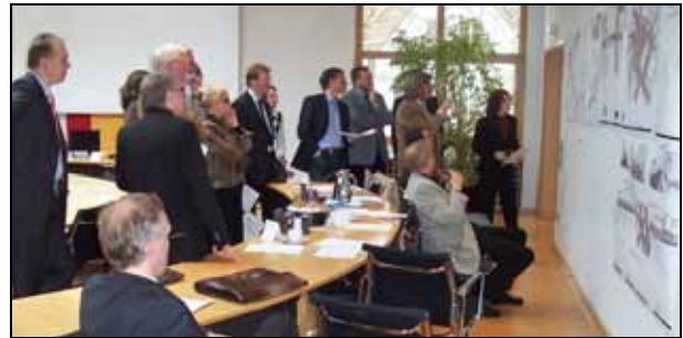
Abb. 1: Das Auswahlgremium analysiert, begutachtet, diskutiert und bewertet die Entwürfe der drei beauftragten Planungsbüros

Abb. 2: Detailbeispiel des Entwurfes Lohaus & Carl: Der Marktplatz wird durch einen hellen Belag gefasst, die Terrasse verkleinert und geöffnet →