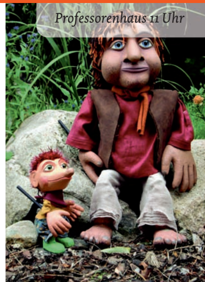
Professorenhaus 11 Uhr

Das Stück "Großer Kleiner Riese" handelt davon, dass selbst der Größte und Stärkste manchen Dingen gegenüber machtlos ist, dass man wahre Freunde nur gewinnt, wenn man Ihre Grenzen achtet, und dass so mancher Riese erst ganz klein werden muss, um richtig groß zu sein.