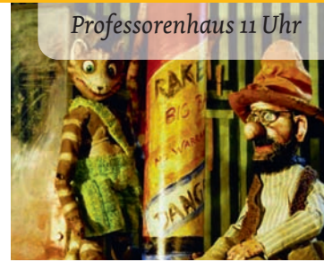
Professorenhaus 11 Uhr

Der Nachbar Gustavsson ist mit seinem Hund Bello auf der Jagd nach dem Fuchs, der ihm ein Huhn geklaut hat. Auch Petterson soll sein Gewehr bereithalten. Doch Findus ist der Meinung, dass man Füchse nicht erschießen soll, sondern reinlegen. So lassen sich Petterson und Findus einiges einfallen, um den Fuchs zu verjagen. Ein explodierendes Huhn, ein Feuerwerk und ein spukender Kater – das müsste eigentlich reichen.