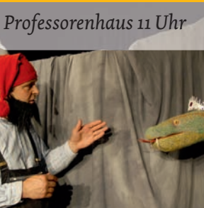
Professorenhaus 11 Uhr

Was machen zwei Erzählzwerge, um ganz GROß rauszukommen? Sie erzählen ein großartiges Märchen. Vom Sternenmännlein zum Beispiel, das fantastische Geschichten von den Sternen vorträgt - zur Freude aller Dorfbewohner und zu seinem eigenen Glück. Als ein paar große Tiere ihm versprechen mithilfe von Luftkugeln, Blinkkrone und Flitzeschuhen erhöhe sich die Wirkung seiner Geschichten, passiert es: Das Sternenmännlein kann der Verlockung nicht widerstehen und zieht mit den neuen glänzenden Dingen hinaus in die Welt. Doch hinter dem Reiz der neuen Mittel verblasst alsbald die Fantasie und im tiefen Tal seines hurtigen Aufstiegs fasst das Sternenmännlein einen Beschluss.