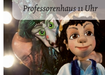
Professorenhaus 11 Uhr

Aladdin ist ein ungehobelter Tunichtgut, der niemandem Respekt erweist. Eines Tages taucht ein geheimnisvoller Fremder in der Stadt auf. Er verspricht Aladdin, ihm zu Reichtum und Ansehen zu verhelfen. Eine Bedingung gibt es jedoch: Aladdin muss für den unheimlichen Mann in eine geheime Höhle steigen, um eine alte Lampe für ihn zu beschaffen. Schnell muss er feststellen, dass er von dem Fremden betrogen wurde. Nachdem Aladdin die Lampe gründlich untersucht hat, erscheint vor ihm ein gewaltiger Geist. Eine abenteuerliche Reise, voller magischer Begegnungen in der zauberhaften Welt des Orients, beginnt.