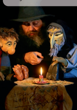
Professorenhaus 11 Uhr