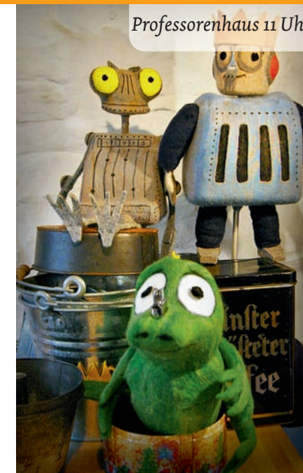
Professorenhaus 11 Uhr

Ein schwungvoll inszeniertes Musical, gespielt und gesungen mit Figuren und einem Radio in einer vorweihnachtlichen Backstube.