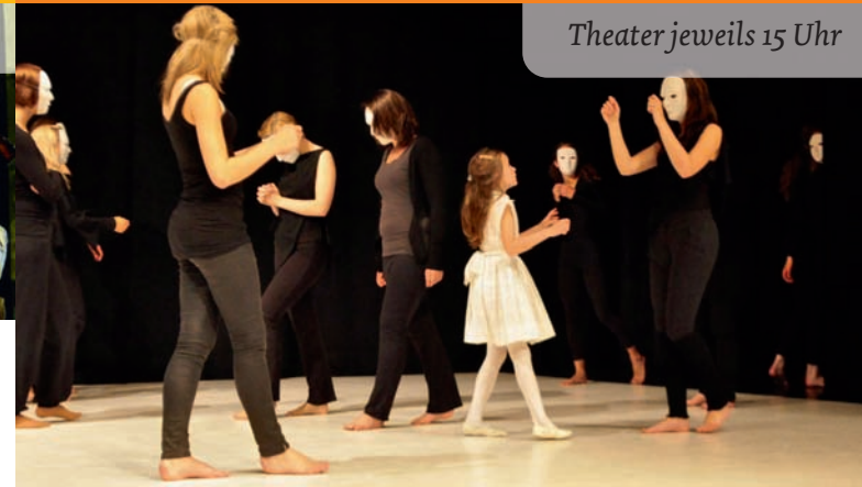
Theater jeweils 15 Uhr